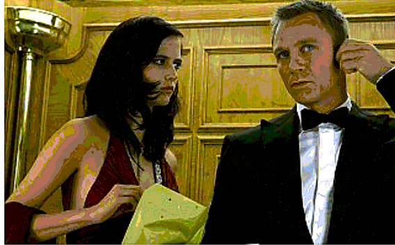
Casino Royale Eva Green e Daniel Craig in uno dei film della saga di 007

«Flop Secret» (Paesi edizioni, 112 pagine), racconta, con una buona dose di umorismo, le avventure dell'agente Barbarossa