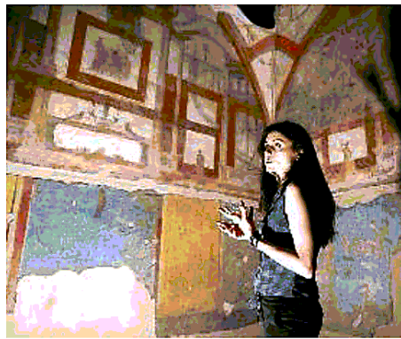
Uno degli ambienti della Domus